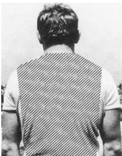
lorsqu'un lutteur est plaqué au sol entièrement.

Une passe est considérée comme terminée si un adversaire est vainqueur ou si la durée de la passe est écoulée. La décision d'une passe intervient